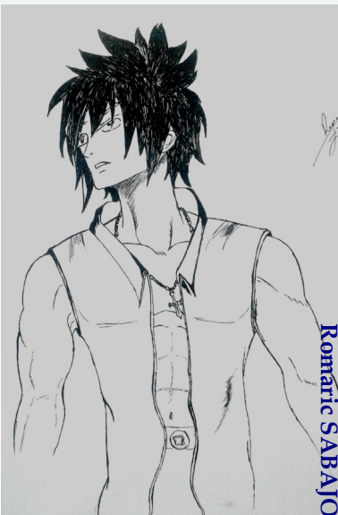
Michotte en parle !

Exposition de dessins Mangas et Comics au CDI jusqu'au 10/01/2017